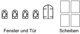
Fenster und Tür